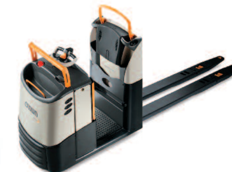
Serie GPC 3000 Commissionatori orizzontali Disponibile con tecnologia QuickPick® Remote Portata: 2000, 2500 e 2700 kg