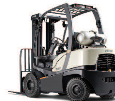
Serie C-5 Carrello controbilanciato a 4 ruote con motore GPL e pneumatici superelastici Portata: 2000 e 3000 kg Altezza di sollevamento: 2920 a 7465 mm