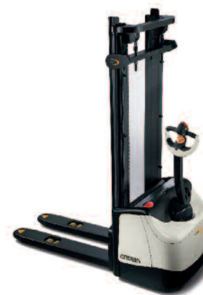
Serie WF 3000 Sollevatore per pallet Portata: 1000 e 1200 kg Altezza di sollevamento: da 1550 a 4400 mm

I sollevatori a zanche ST, SX e SH operano in spazi ristretti, per uno sfruttamento più efficiente delle aree di stoccaggio limitate. I modelli WF, ES e ET a forche ricoprenti sono ideali per gestire con efficienza i contenitori a gabbie, gli europallet e i contenitori su slitta. Inoltre eliminano lo spazio zanche richiesto dai sollevatori, il che consente di sfruttare maggiormente i volumi. Gli stoccatrici a sollevamento iniziale ESi ed ETi offrono le funzionalità di ES e ET ed inoltre la versatilità data dall'elevazione delle razze. I sollevatori doppi DT sono perfetti carrelli "dalle scorte al carico", con la capacità di collocare due europallet alla volta. Il sollevatore retrattile SHR aumenta straordinariamente la versatilità di movimentazione dei carichi, mantenendo al contempo una buona manovrabilità.