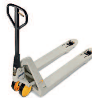
Serie PTH 50 Transpallet manuali

I commissionatori orizzontali GPC 3000 sono inoltre utilizzabili in combinazione con la tecnologia QuickPick® Remote, per ottenere straordinari miglioramenti nelle applicazioni di commissionamento.