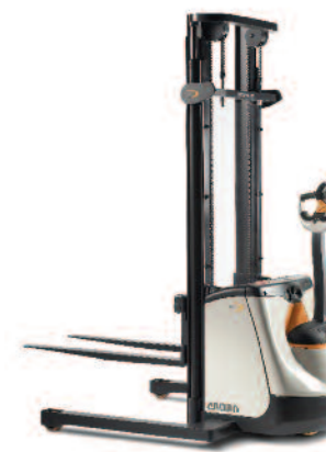
Serie ST 3000 Sollevatori a zanche larghe Portata: 1000 kg Altezza di sollevamento: da 2400 a 4250 mm