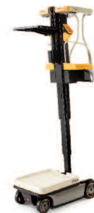
Serie WAV 60 Work Assist Vehicle

Tutti i carrelli a posto guida elevabile possono essere equipaggiati per operare in applicazioni a corsia molto stretta (VNA) per sfruttare al massimo gli spazi.