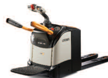
Serie WT 3000 Transpallet elettrici con piattaforma ribaltabile Portata: 2000 e 2500 kg