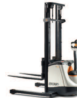
Serie SX 3000 Sollevatori a zanche larghe Portata: 1350 kg Altezza di sollevamento: da 2400 a 4250 mm