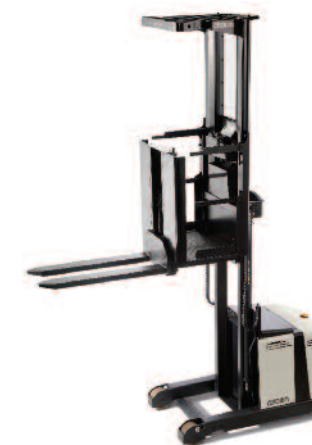
Serie LP 3500 Commissionatore di medio livello

Portata: griglia di carico da 90 kg, piano di carico da 115 kg Altezza di sollevamento piattaforma: da 2995 mm