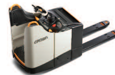
Serie WT 3000 Transpallet elettrici con piattaforma fissa Portata: 2000 e 2500 kg