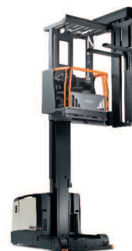
Serie TSP 6000 Trilaterale

Portata: 625 e 1250 kg Altezza di sollevamento: da 5335 a 9295 mm