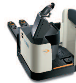
Serie PR 4500 Transpallet uomo a bordo Portata: 3000 kg