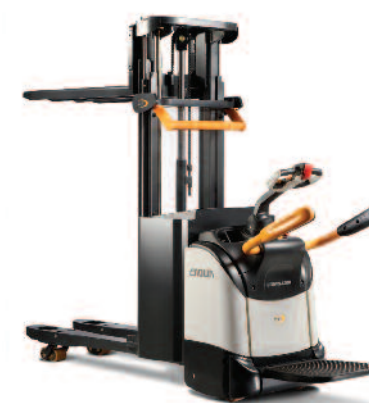
Serie DT 3000 Sollevatore doppio

Portata: 2000 kg Altezza di sollevamento: da 1700 a 2600 mm