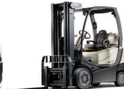
Serie C-5 Carrello controbilanciato a 4 ruote con motore GPL e pneumatici Cushion Portata: 2000 e 3000 kg Altezza di sollevamento: 2920 a 7465 mm