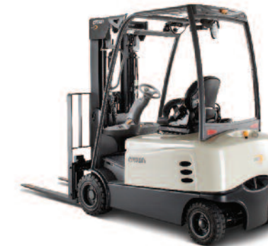
Serie SCF 6000 Carrello controbilanciato a 4 ruote Portata: 1600, 1800 e 2000 kg Altezza di sollevamento: da 2890 a 7495 mm