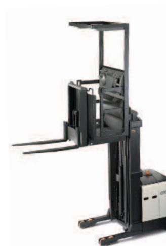
Serie SP 3500 Commissionatore a 3 punti di appoggio

Portata: 1000, 1250 e 1500 kg Altezza di sollevamento: 4900 a 17145 mm