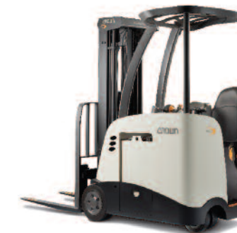
Serie RC 5500 Carrello controbilanciato a 3 ruote con operatore in piedi Portata: 1500 e 1800 kg Altezza di sollevamento: da 3910 a 7010 mm