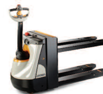
Serie WP 3000 Transpallet elettrico ad alto sollevamento, in grado di sollevare carichi fino a 750 mm Portata: 800 e 2000 kg