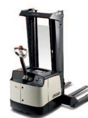
Serie SH 5500 Sollevatori a zanche larghe

Portata: 2000 kg Altezza di sollevamento: da 1700 a 2600 mm