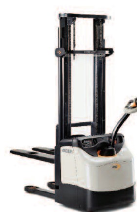
Serie ES 4000 Sollevatore per pallet

Portata: 1200, 1400 e 1600 kg Altezza di sollevamento: 2440 a 5400 mm