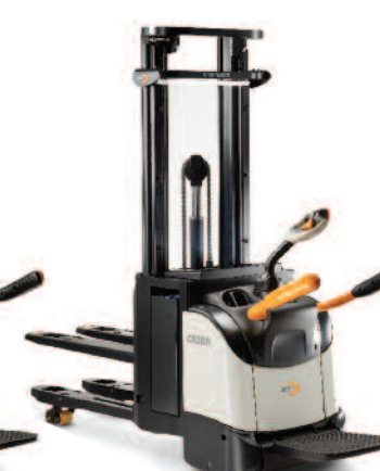
Serie ETi 4000 Sollevatore per pallet a sollevamento iniziale

Portata: 1200, 1400 e 1600 kg Altezza di sollevamento: 2440 a 5400 mm