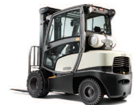
Serie C-5 Carrello controbilanciato a 4 ruote con motore GPL e cabina completa Portata: 2000 e 3000 kg Altezza di sollevamento: 2920 a 7465 mm