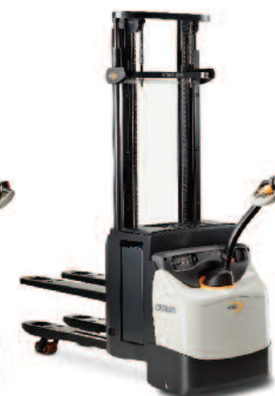
Serie ESi 4000 Sollevatore per pallet a sollevamento iniziale

Portata: 1200, 1400 e 1600 kg Altezza di sollevamento: 2440 a 5400 mm