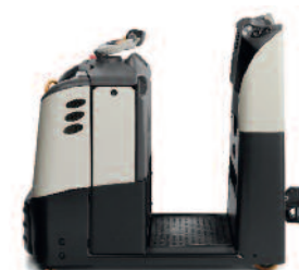
Serie TC 3000 Trattore Portata carico in movimento: 3000 kg