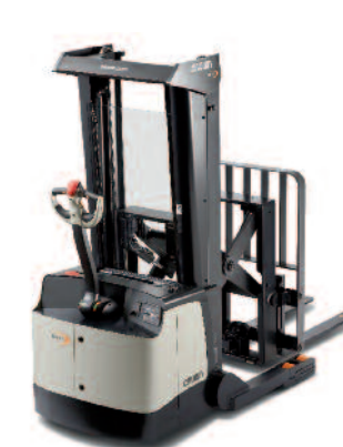
Serie SHR 5500 Sollevatore retrattile

Portata: 1800 kg Altezza di sollevamento: da 3225 a 4875 mm