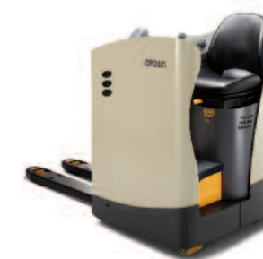
Serie RT 4000 Transpallet uomo a bordo Portata: 2000 g