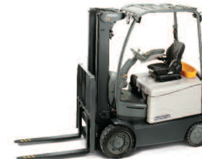
Serie FC 5200 Carrello controbilanciato a 4 ruote Portata: 2000, 2500 e 3000 kg Altezza di sollevamento: da 3200 a 7925 mm