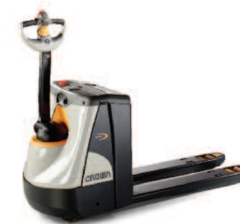
Serie WP 3000 Commissionatori orizzontali