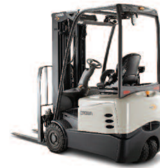
Serie SCT 6000 Carrello controbilanciato a 3 ruote Portata: 1300, 1600, 1800 e 2000 kg Altezza di sollevamento: da 2890 a 7495 mm

La serie C-5 a quattro ruote con motore GPL è progettata per durare a lungo in ambienti di lavoro difficili, a elevato utilizzo. Realizzata con componenti in grado di resistere nelle applicazioni industriali più dure incrementando al contempo la produttività, la serie C-5 è disponibile anche con cabina parziale o completa.