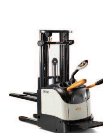
Serie ET 4000 Sollevatore per pallet

Portata: 1200, 1400 e 1600 kg Altezza di sollevamento: 2440 a 5400 mm