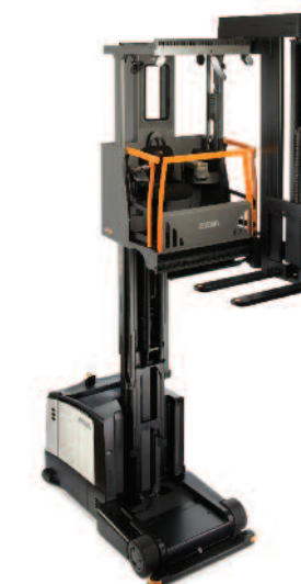
Serie TSP 6500 Trilaterale

Portata: 1000 e 1250 kg Altezza di sollevamento: da 4900 a 11660 mm