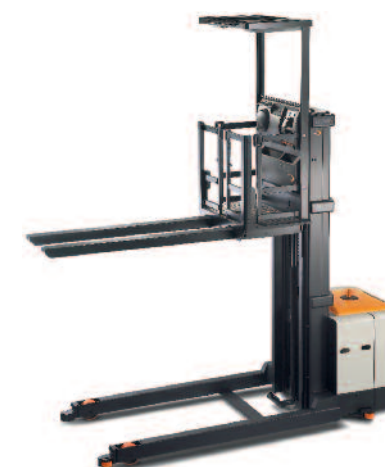
Serie SP 3500 Commissionatore a 4 punti di appoggio

Portata: 1000 e 1250 kg Altezza di sollevamento: da 4215 a 9600 mm