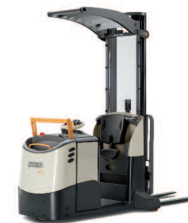
Serie MPC 3000 Commissionatori con montante Portata: 1200 kg Altezza di sollevamento: 800 a 4300 mm